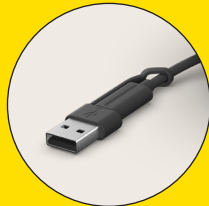
USB A & USB C 단자 포함