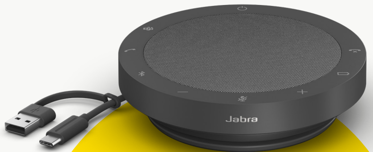
MS TEAMS 및 UC 모델

Speak2 55는 제품 개발의 전 과정에서 신중하게 지속가능성을 고려하여 설계되었습니다. Speak2 55의 휴대용 파우치는 50% 이상의 지속가능한 소재**로 제작되었으며, 내장된 부품 역시 교체 및 수리할 수 있는 소재로 설계되었습니다. 지속가능한 제품으로 협업을 더욱 가치 있게 만들어 보세요.